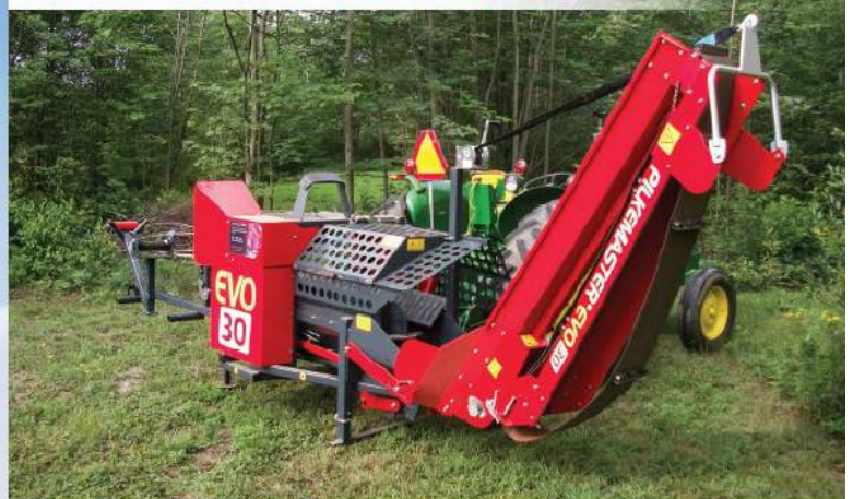
PROCESSEUR À BOIS