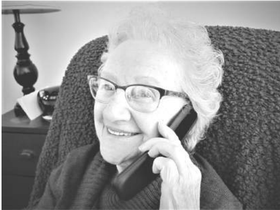
De la part de vos enfants